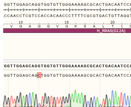
Fig 2. Sanger 测序结果

活细胞百分比 = (加药孔 - assay buffer 孔) / (不加药孔 - assay buffer 孔)